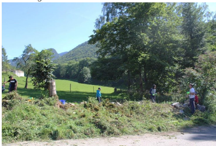
Figure 4 : Journée de débroussaillage avec une classe du Val-de-Ruz 21.08.2017