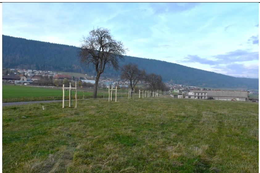
Figure 15-18 : journée de plantation participative mesure C.2 - Cernier