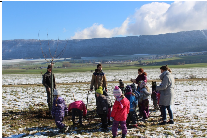
Figure 11-12 : plantation d'une rangée de fruitiers haute tige avec une classe enfantine de Vilars, mesure B.1.3- Cernier