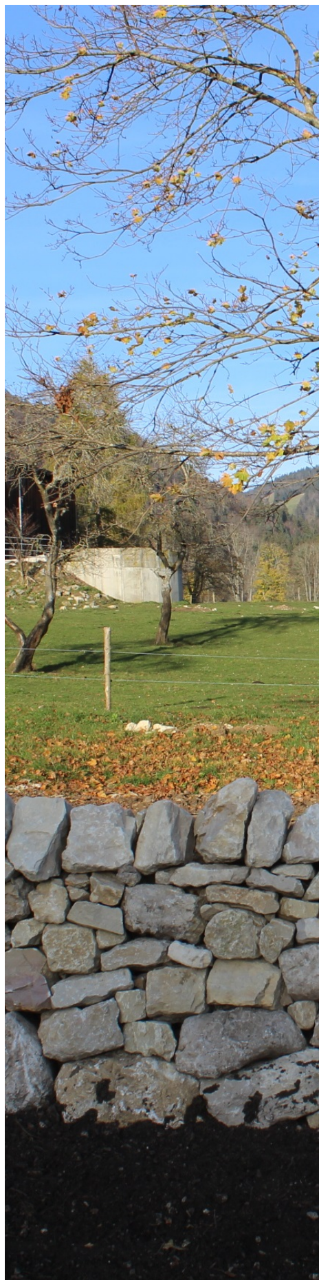
Figure 2 : Mur restauré au Pâquier C.3.3