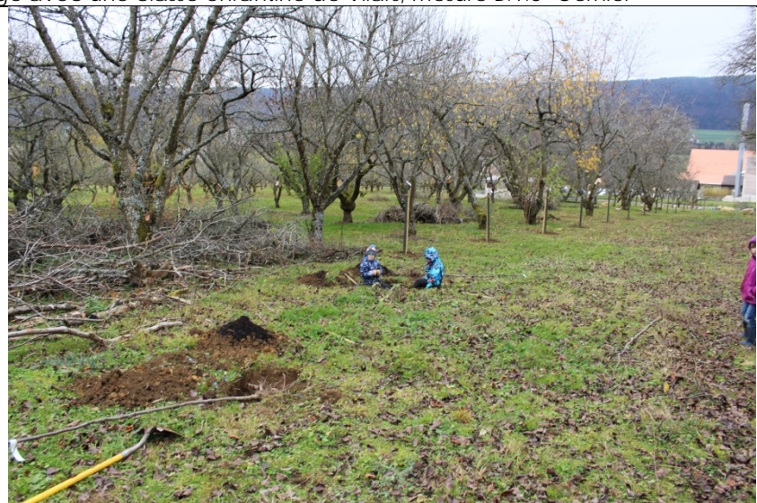
Figure 13-14 : plantation d'une rangée de fruitiers haute tige avec une classe enfantine de Vilars, mesure A.2- Cernier