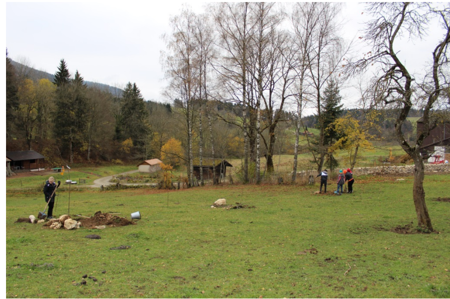
Figure 7-10 : ½ journée de plantation avec une classe d'adolescents de Malvilliers, 09.11.2017