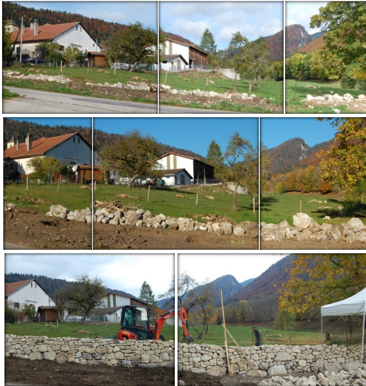
Figure 5 Suivi photographique du chantier de restauration du mur