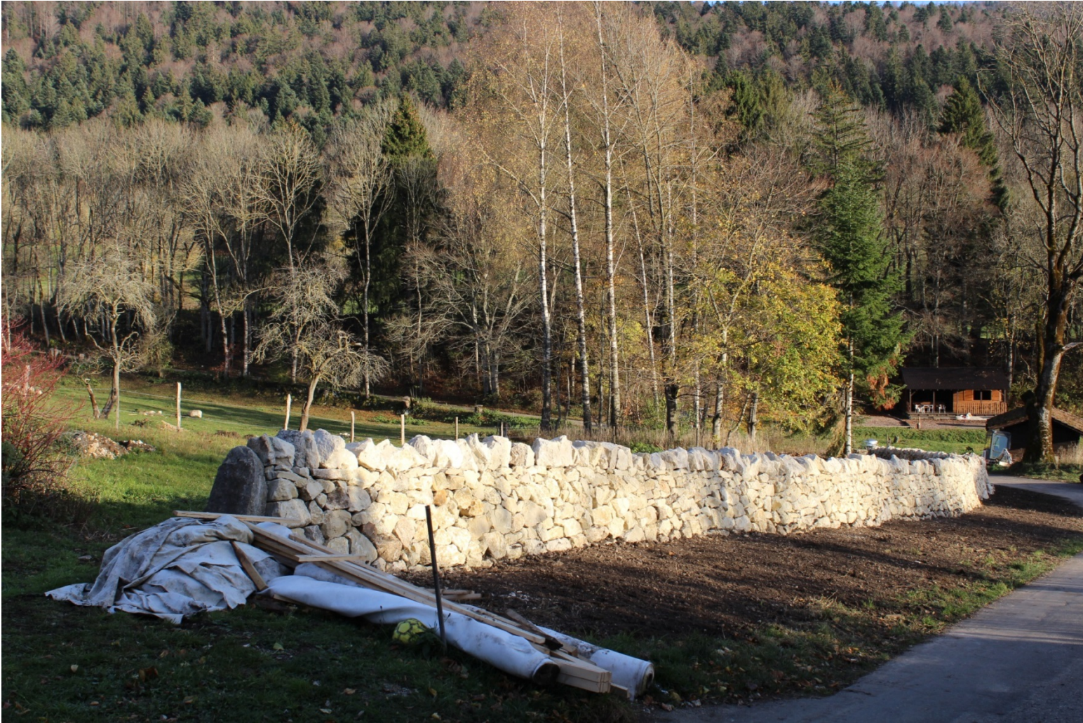
Figure 6 C.3.3 mur entièrement restauré