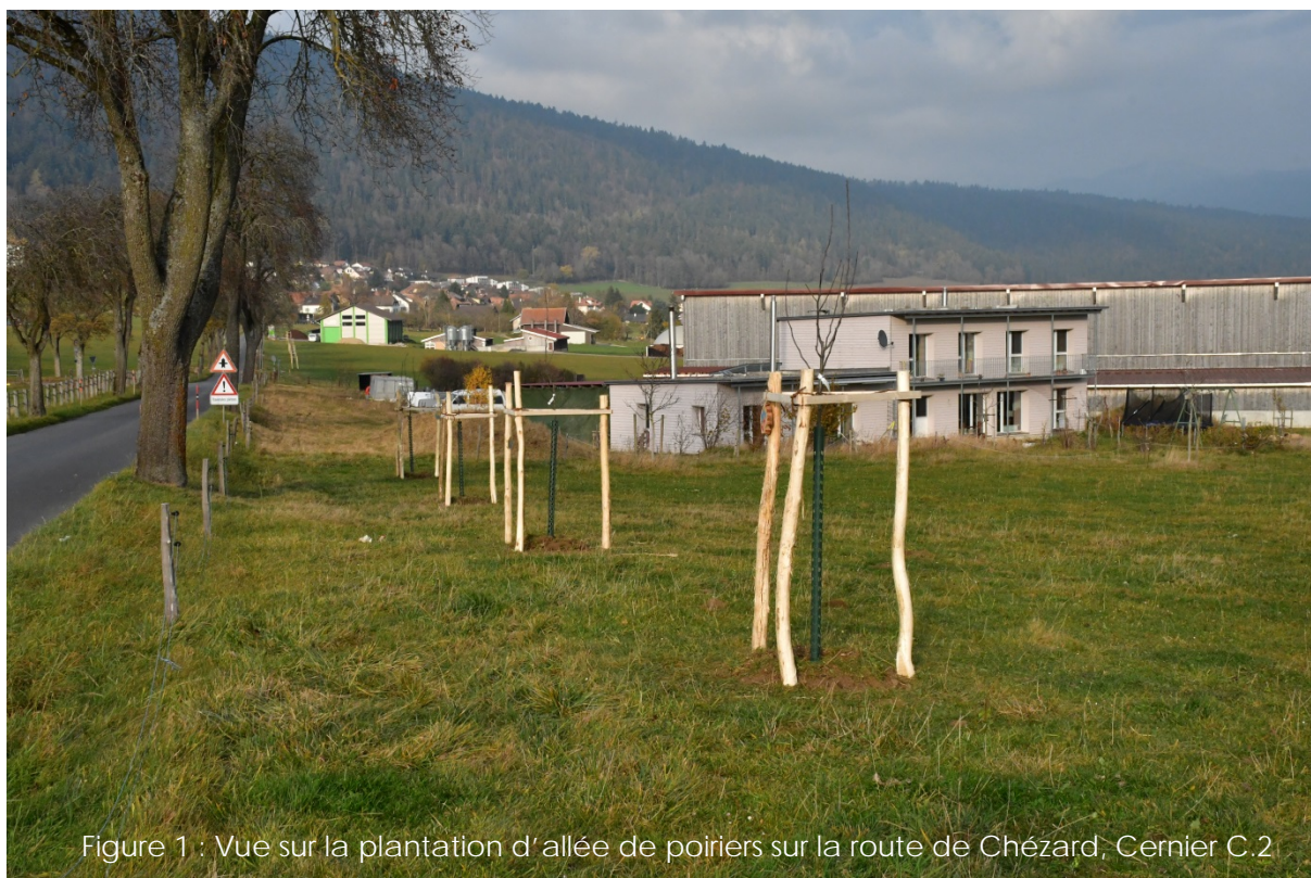
Figure 1 : Vue sur la plantation d'allée de poiriers sur la route de Chézard, Cernier C.2